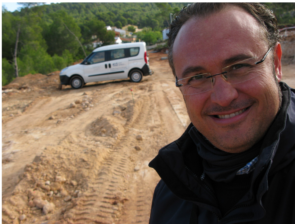
Urbanización de Viales en Jávea, 2014

Análogamente desarrollamos el Project Monitoring de los Proyectos en curso, reportando en todo momento la documentación acreditativa de las actividades en curso y con un resultado justificado de todo el proceso constructivo, con sujeción a la calidad, plazos y costes fijados por el cliente.