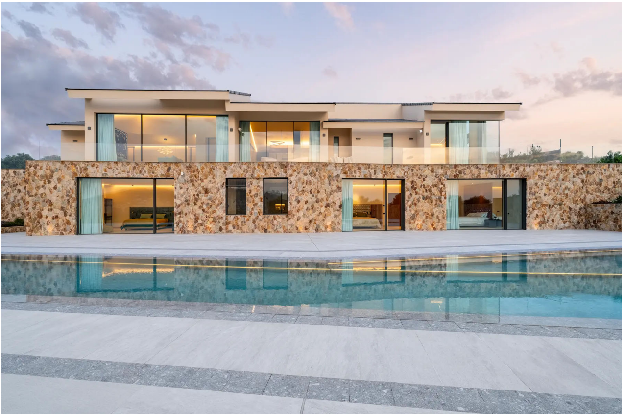
Villa Palisandro – Jávea

En EQ, convertimos la Arquitectura y la Ingeniería en una forma de autoría. Cada proyecto es una obra única concebida desde la honestidad, el rigor y la belleza constructiva.