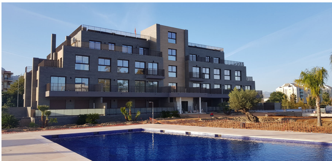
Complejo Residencial las Lomas de Dénia, Bloque 2