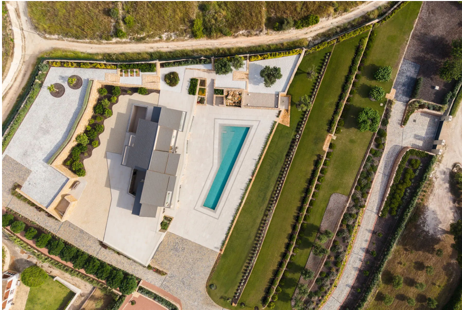
Villa Palisandro Jávea

Disponemos de equipos técnicos en Dénia y Ibiza completos, con un Arquitecto Técnico a pie de obra, encargados de obra, industriales locales e industriales colaboradores de EQ en la península desplazados a la isla.