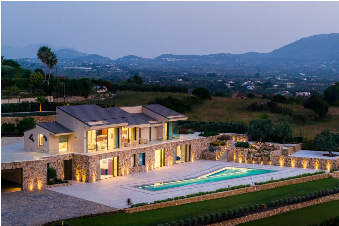
Villa Palisandro - Jávea

.- Reporte a la Propiedad de los resultados obtenidos apoyando a la Gerencia en el enfoque de la gestión futura de las obras finalmente ejecutadas.