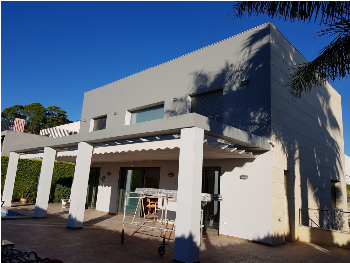
Vivienda unifamiliar en Pego, 2007

Análogamente, estamos capacitados para la ejecución de cualquier tipo de edificación, desde la vivienda unifamiliar de cierta envergadura hasta la edificación completa y urbanización interior de la misma.