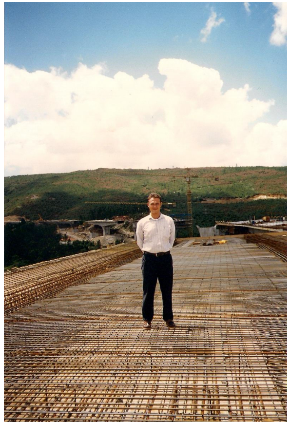
Ponte de Coura, Portugal, 1997