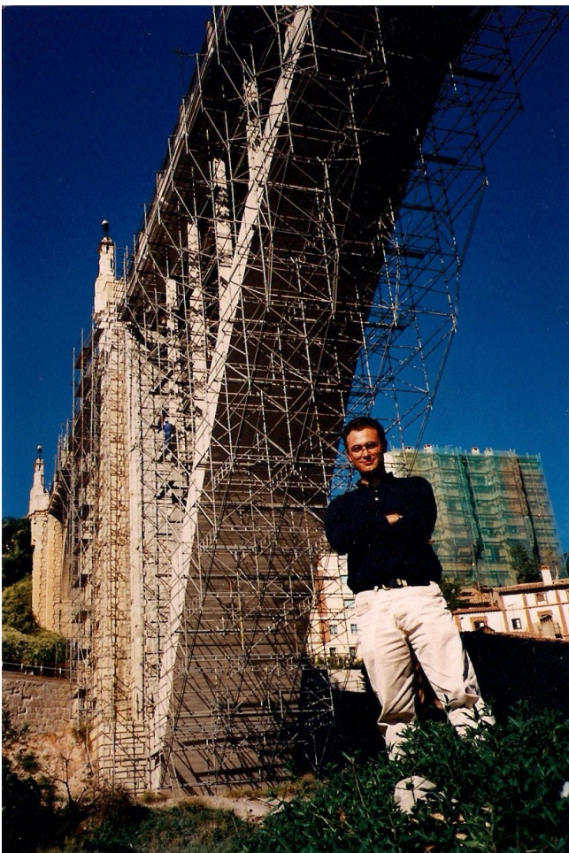
Viaducto Antiguo de Teruel, 1996