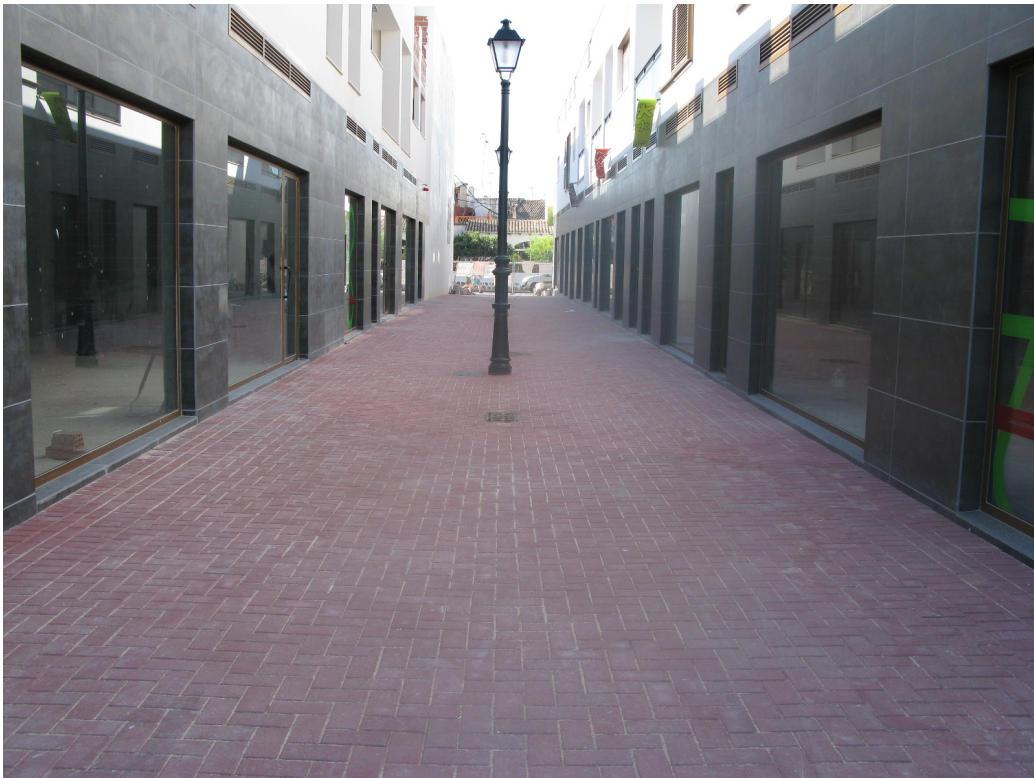
Calle Peatonal en Els Poblets – 2009

Ofrecemos la posibilidad del estudio de licitaciones de obras para la administración en al ámbito de edificación como de obra civil, así como el seguimiento de su ejecución.