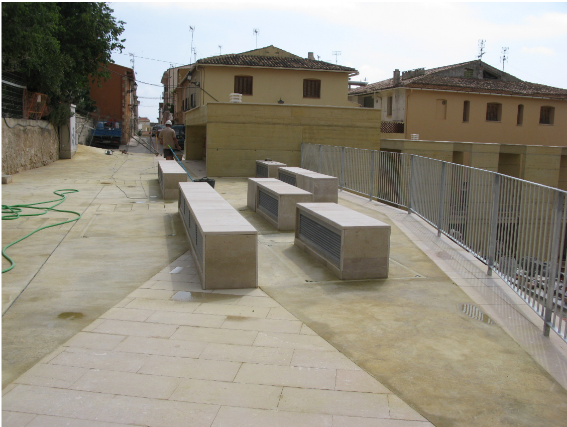
Plaza del Consell en Dénia - 2011

Son numerosas las obras en las que 2002 EPSICU S.L. ha llevado a cabo esta labor, con resultados positivos que podemos acreditar a petición de la Propiedad y con el staff técnico que figura en el presente documento de presentación.