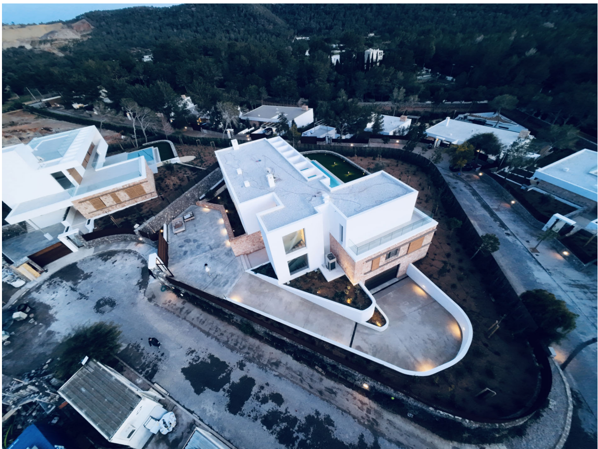
Villas P14 y P21 – Can Aubarca

- La dirección de la ejecución material de las obras, faceta destacable en el ejercicio profesional, especialmente en las grandes promociones y que se ha visto fuertemente impulsada después de la promulgación de la LOE, por mor de la específica configuración que de dicha función profesional se contempla en su artículo 11.2.c).