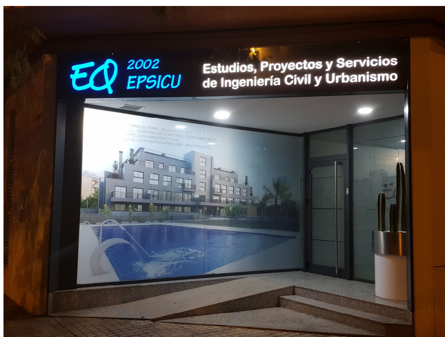
Despacho EQ en Dénia

Una creciente intervención en materia de programación y control de calidad, con todo lo que lleva implícito, interviniendo en los procesos de fabricación de materiales y elementos para la construcción, y especialmente al control de su producción y control de recepción.