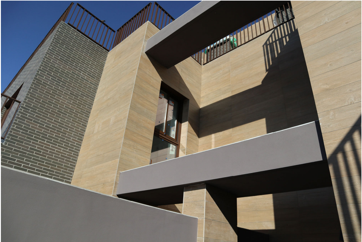
Complejo Residencial las Lomas de Dénia, Bloque 2

Aplicando este procedimiento hemos desarrollado los EDIFICIOS 1 y 2 del RESIDENCIAL LAS LOMAS DE DÉNIA.